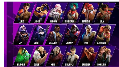
『ストリートファイター6』の追加コスチューム 「Outfit 3」が12月1日より販売開始

※「ロックマンエグゼ アドバンスドコレクション Vol.1」と「ロックマンエグゼ アドバンスドコレクション Vol.2」の合計値