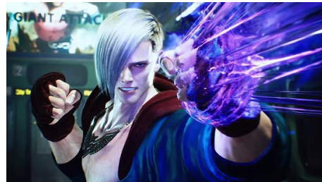
『ストリートファイター6』Year1追加キャラクター 第3弾「エド」が2月に配信予定