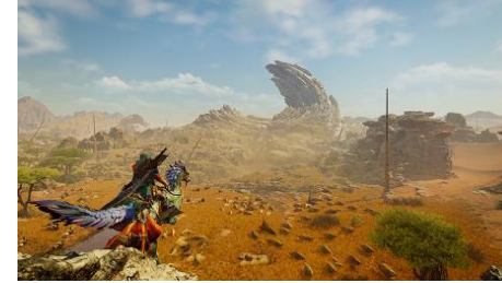
シリーズ最新作『モンスターハンターワイルズ』 を2025年に投入予定