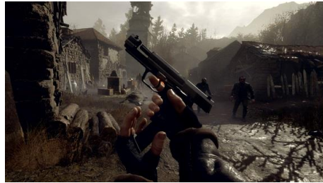
無料DLC『バイオハザード RE:4 VRモード』が 12月8日より配信