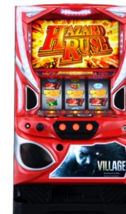
スマスロ『バイオハザード ヴィレッジ』