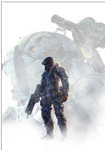
ロスト プラネット “LOST PLANET”