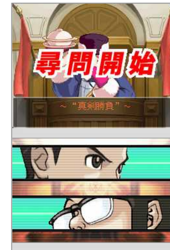
逆転裁判4 “Phoenix Wright 4”