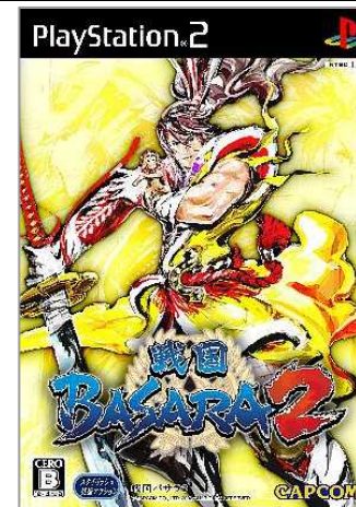
戦国BASARA2 Devil Kings 2

日本のモンスターハンターポータブルは、 リピートと廉価版合計 Both Repeat order and Greatest hits.