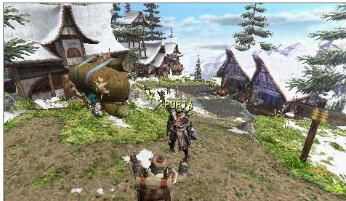
モンスターハンターポータブル 2 nd “Monster Hunter Freedom 2 nd ”