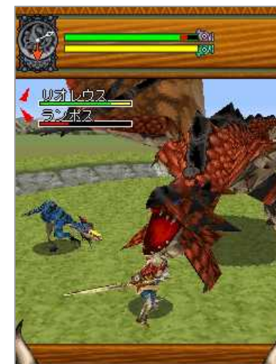
「モンスターハンター」 “Monster Hunter” (Mobile)