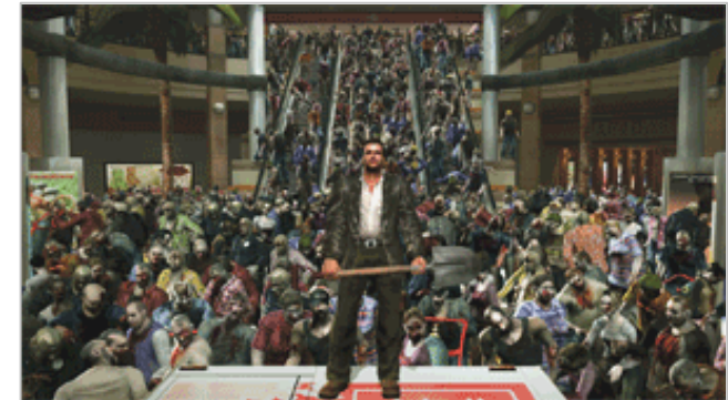
デッドライジング Dead Rising