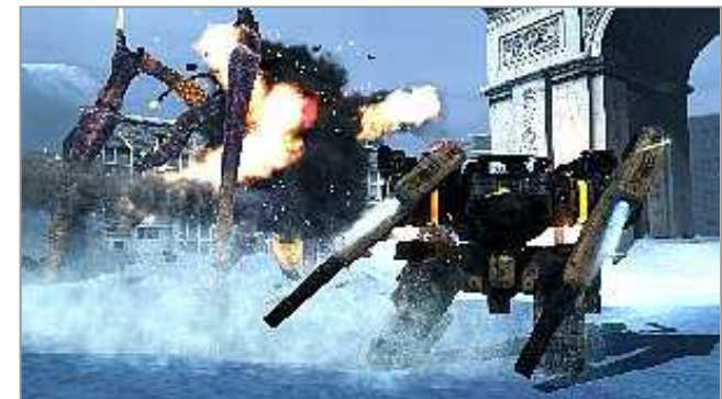
ロストプラネット Lost Planet

There have been over 600,000 downloads of the demo version from Xbox Live