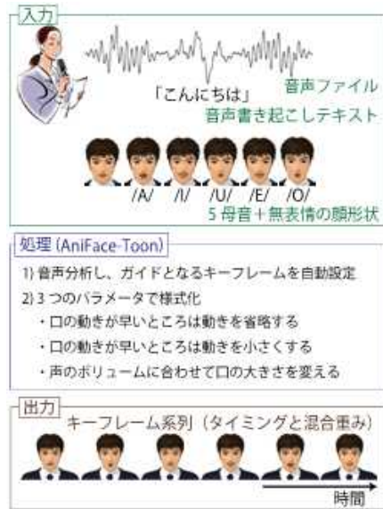
図 1 「AniFace」概要

戦国時代の武将や史実を主軸としながらも、ユニークで斬新な世界観を創造した戦国アクションゲームです。現代的にアレンジされた魅力的な戦国武将が若いユーザー層に親しまれています。2005年の第1作発売以降、ゲームソフトだけでなく各種関連イベントやグッズなどへの展開、また2009年にはTVアニメも放映されるなど、様々なメディアで相乗効果を産み出している作品です。シリーズ最新作の『戦国 BASARA 3』は2010年に発売予定です。